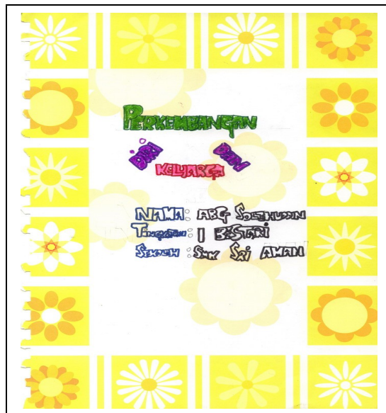
Gambar 1: Contoh hasil kerja pelajar